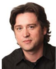
François Boucher B. Éd. Conseiller en SST